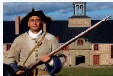
Alle Fotos in Nova Scotia aufgenommen