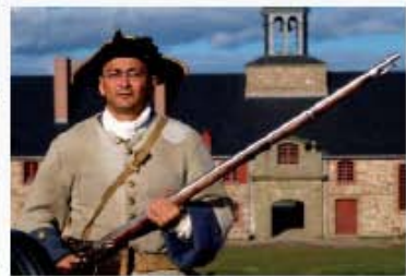
Alle Fotos in Nova Scotia aufgenommen